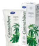
Gel 200 ml CN 204960.4